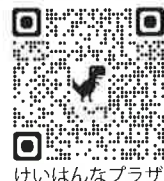
けいはんなプラザ